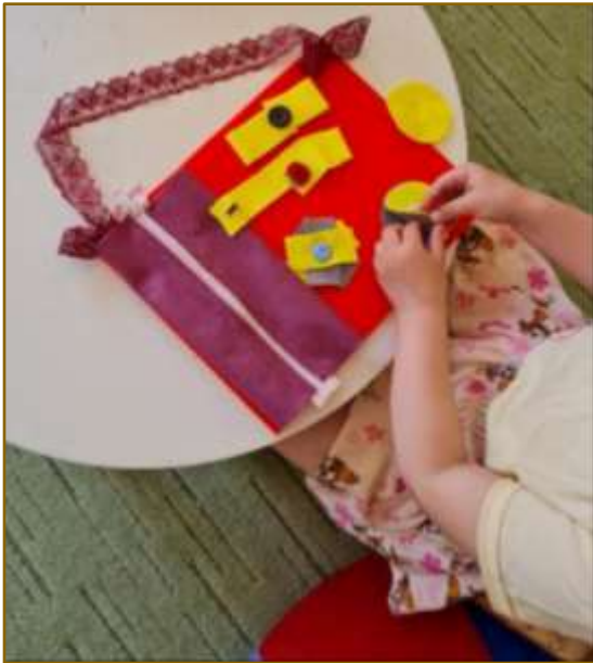
1. attēls. Didaktiskais materiāls „Vingrie pirkstiņi”

paredzētajā vietā – atbilstoši krāsai. Pēc tā izmantošanas, bērnam izmantotās lietas jānoliek atpakaļ iepriekš noteiktajās vietās - jāsakārto. Materiāls pēc izmantošanas jānovieto atpakaļ noteiktajā grupas vietā. Materiāls paredzēts bērna sīkās motorikas, roku-acu kustību koordinācijas, pacietības attīstībai, kā arī krāsu apguvei.