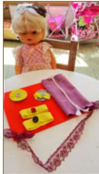
2. attēls. Didaktiskais materiāls „Vingrie pirkstiņi”