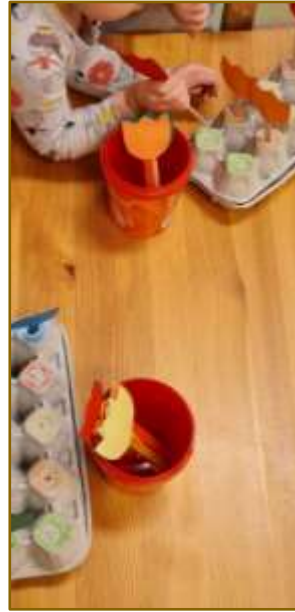
5. attēls. Didaktiskais materiāls „Pavasara ziedi”