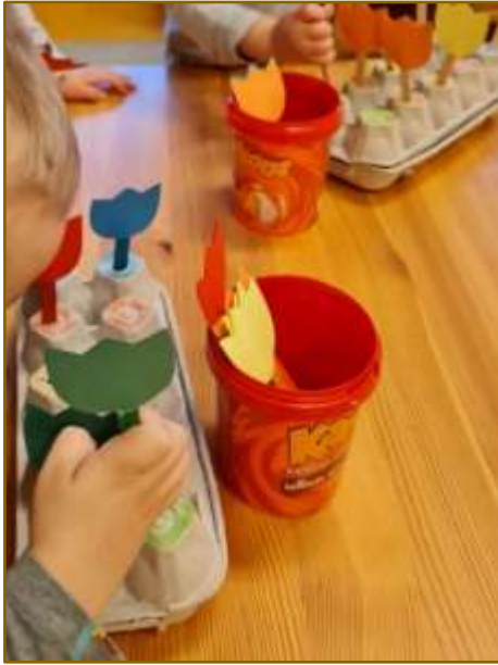
4. attēls. Didaktiskais materiāls „Pavasara ziedi”