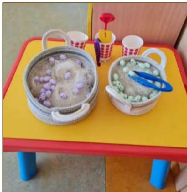
3. attēls. Didaktiskais materiāls „Olu medības”